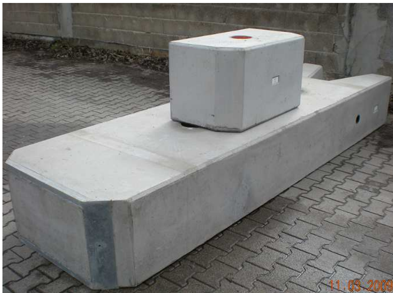
Bild: MD Gegenballast CA 4200 kg und CB 700 kg