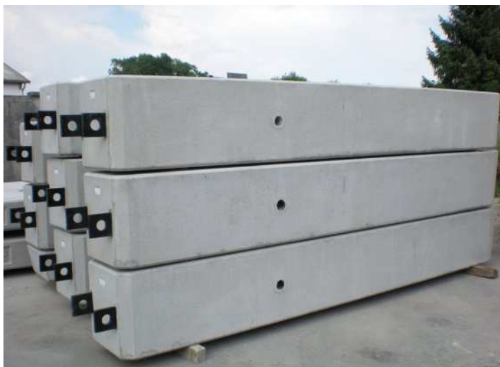
Bild: CBU 3070 Gegenballast für MDT 268, 308, 368