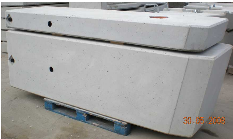
City Gegenballast CAU 3600 kg und CAV 1100 kg